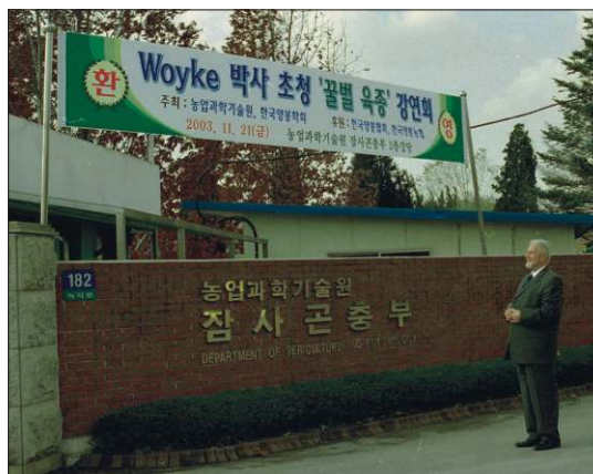
Fot. 2. Transparent powieszony przed bramą Narodowego Instytutu Nauk Rolniczych i Technologii w Suwon w Korei południowej, rok 2003: „Woyke profesor zaprasza na seminarium selekcji i hodowli pszczół”

go dalsze wykłady w Wietnamie Profesor prowadził w języku hiszpańskim. Zostały one przetłumaczone na język wietnamski i w postaci 6 biuletynów rozdane uczestnikom. W Albanii w 1989 roku prowadził co najmniej 9 kursów w języku angielskim, a w Meksyku w 1989 roku – co najmniej – 4 po hiszpańsku oraz w Algierii w 1989 roku – 2 po francusku, łącznie co najmniej 56 kursów.