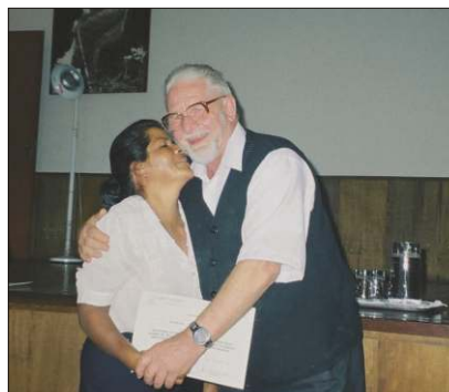
Fot. 3. Indianka w Cañete w Peru, rok 2002, dziękuje profesorowi Woyke po otrzymaniu dyplomu ukończenia kursu genetyki i hodowli pszczół

W Brazylii w roku 1992 Profesor prowadził w języku portugalskim 60 godzin wykładow z genetyki pszczół dla magistrantów na uniwersytecie Saõ Paulo w miejsco-